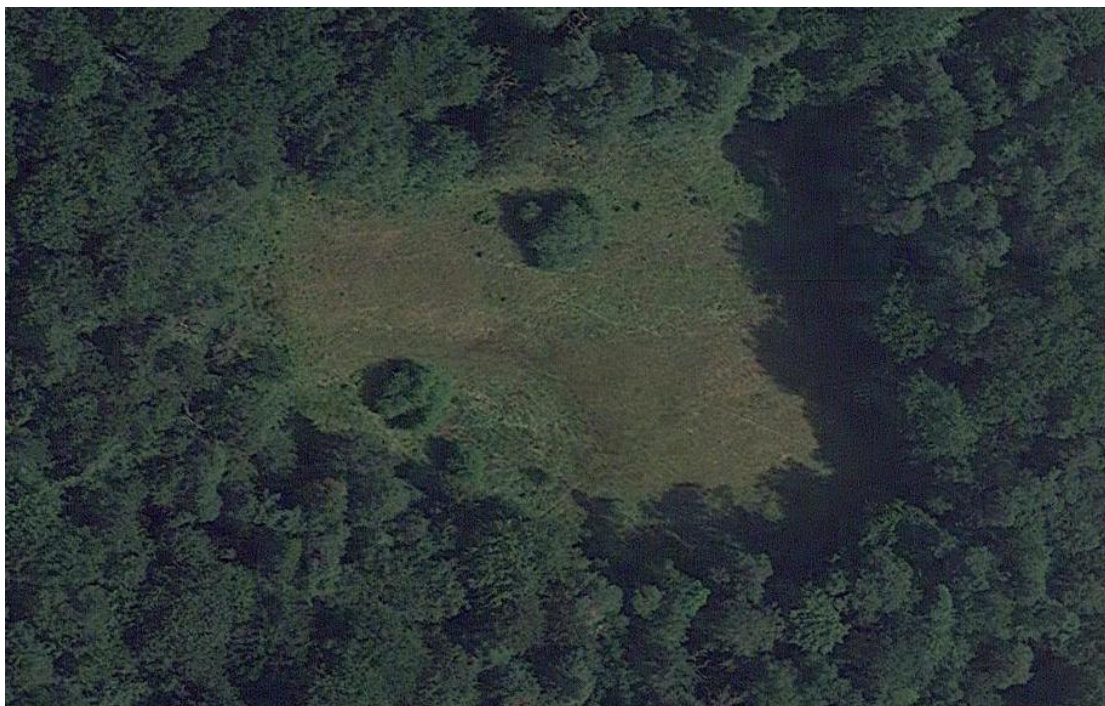
Orchideeënveld MOTKETEL vanuit de lucht