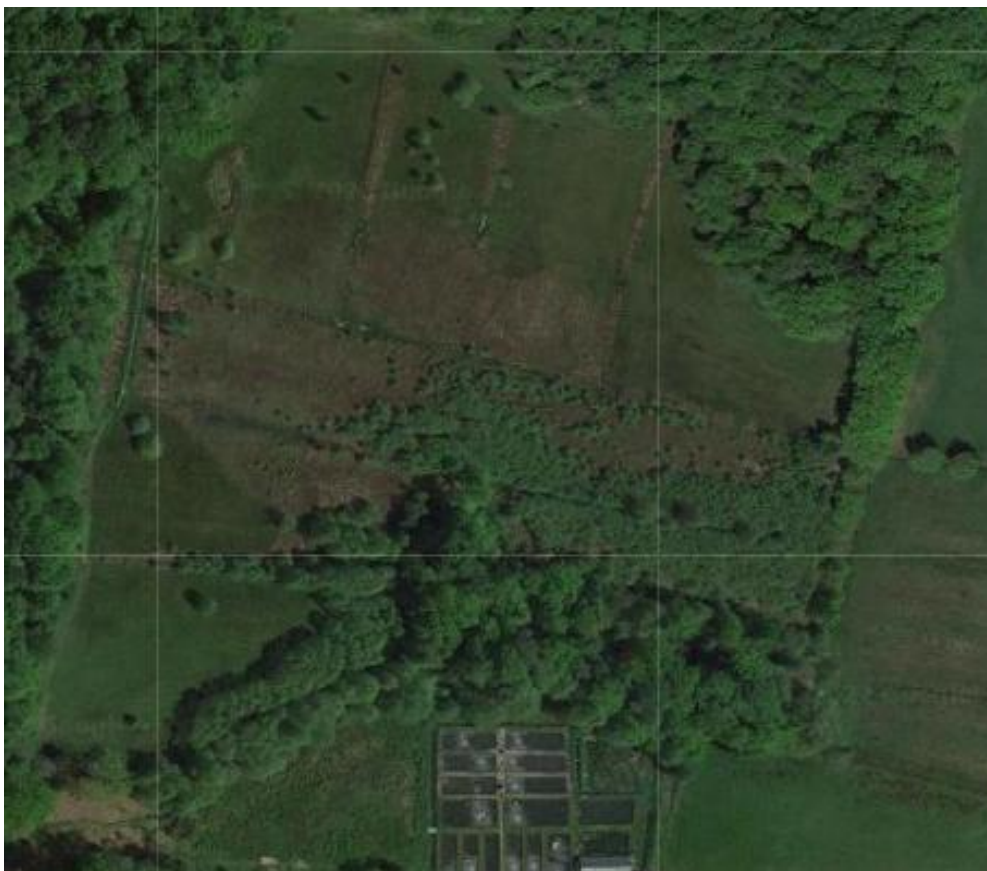
Perceel RODE BEEK vanuit de lucht (NDFF verspreidingsatlas)